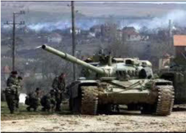
Rat na Kosovu, 1999.