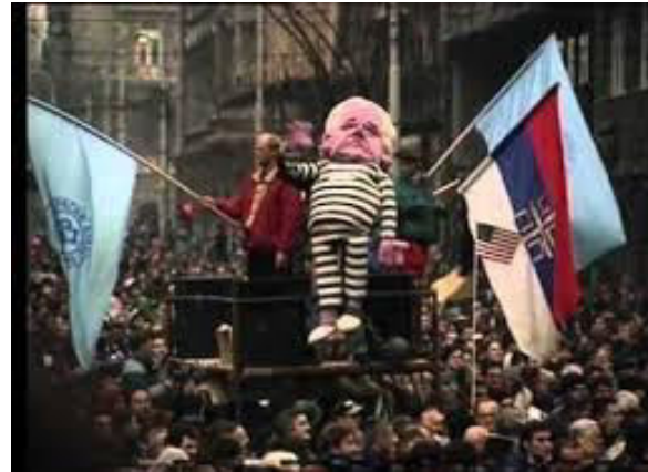
Protesti u Srbiji, 2000.