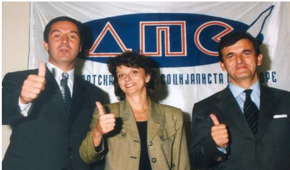
Milo Đukanović, Milica Pejanović - Đurišić i Svetožar Marović - predstavnici DPS

Milo Đukanović na mjestu predsjednika Republike na izborima 2000. godine