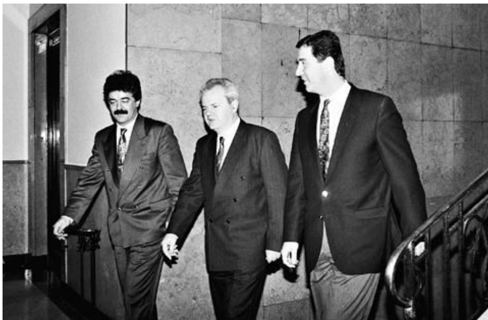
Momir Bulatović, Slobodan Milošević i Milo Đukanović

KP, odnosno novi DPS promiloševićevski orijentisan na početku višestranačja u Crnoj Gori